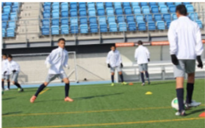
Los niños y jóvenes entrenaron en la Ciudad Deportiva Valdebebas con monitores de las divisiones menores del Real Madrid.

Cuando la delegación arribó a la capital española, la primera actividad planificada por la Fundación fue la visita a la Ciudad Deportiva Valdebebas, donde se observó el entrenamiento del primer equipo del Real Madrid con todas sus figuras.