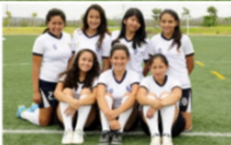
» Categorías Sub 16-17.