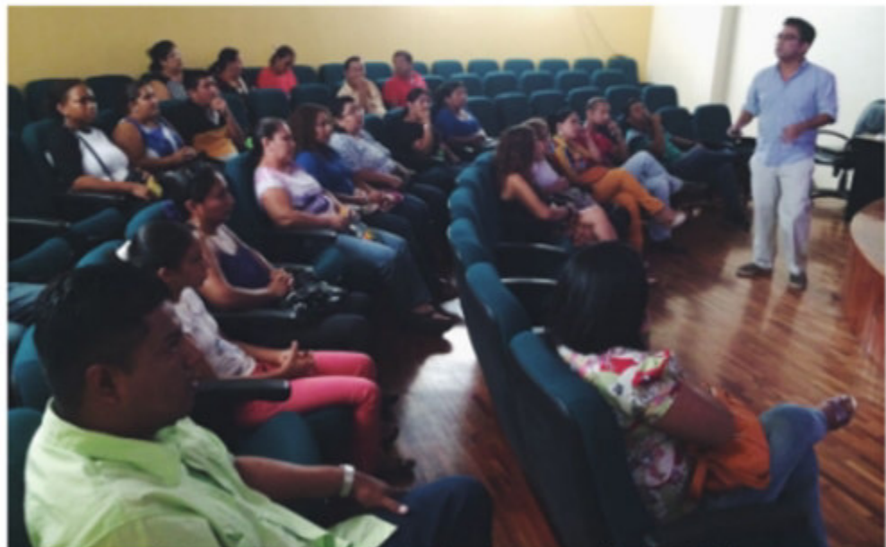
• La Escuela para padres ha permitido que el Centro interactúe con los integrantes de las familias de los menores para conocer su realidad social.

Por ejemplo, a través de esta actividad se han brindado charlas sobre el abuso sexual en niños y jóvenes, un