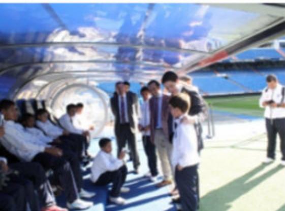
• En el tour por el estadio Santiago Bernabéu la delegación accedió a la zona técnica del Real Madrid FC.