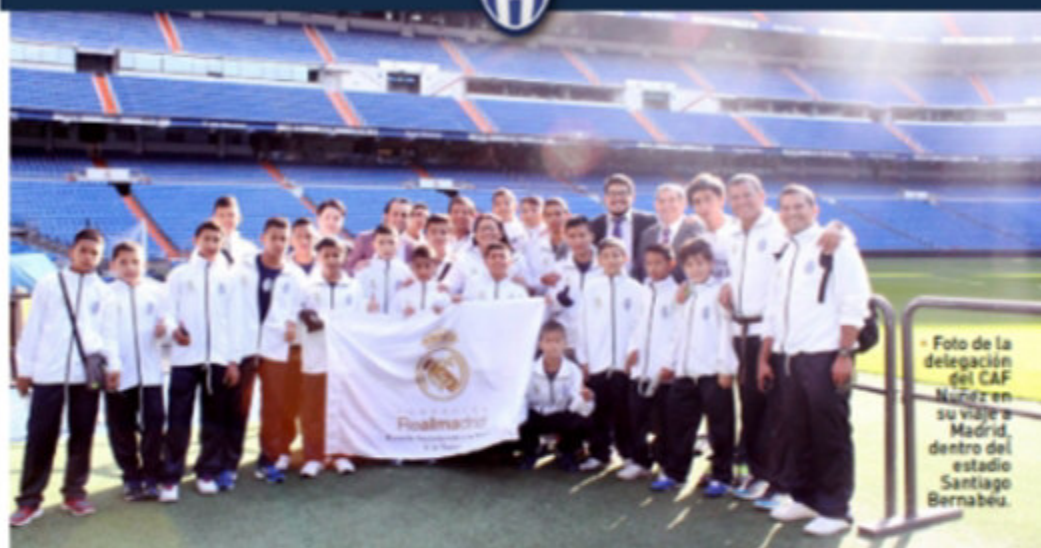
Foto de la delegación del CAF Núñez en su viaje a Madrid, dentro del estadio Santiago Bernabéu.