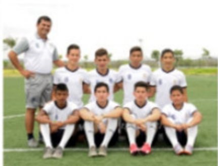
» Categorías Sub 16-17.